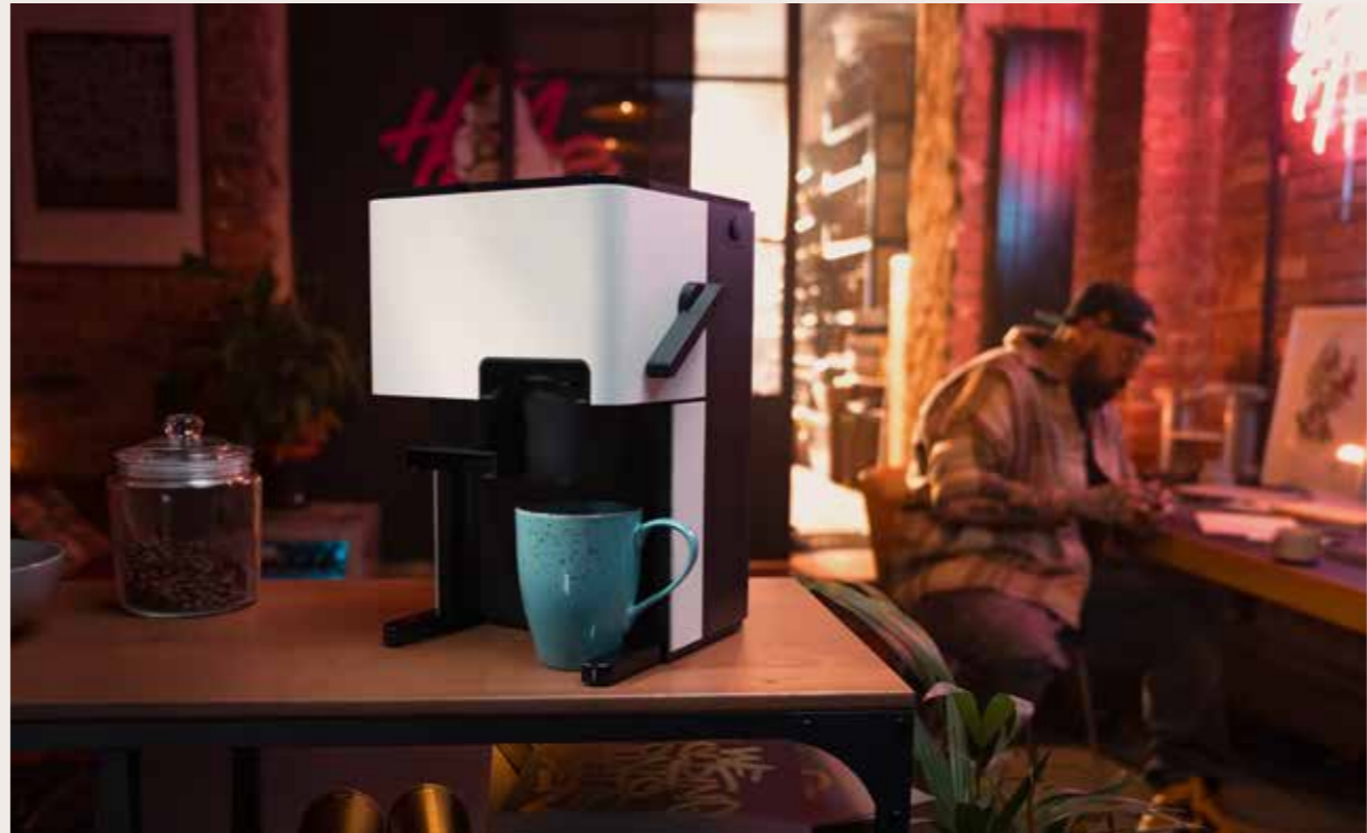
Door het compacte ontwerp van de CUBE 4' past deze in elke omgeving .Of het nu gaat om een studentenwoning, studio of Uitgeruste keuken.