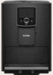
NICR 8'20 Zwart/Chroom