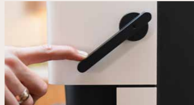
Afbeelding Nr. 03