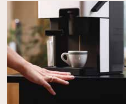
Afbeelding Nr. 04