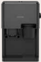
CUBE 4'106 Anthracite