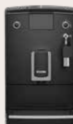
NICR 5'50 Zwart/Chroom