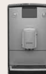
NICR 6'95 Titanium/Chroom