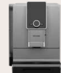
NICR 9'30 Titanium / Chrom