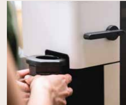
Afbeelding Nr. 02