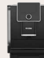
NICR 9'60 Zwart/Chroom