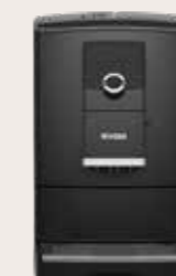
NICR 7'90 Zwart/Chroom

Dankzij de cappuccino-connaisseur kies jij zelf wat er als eerste in het kopje gaat: koffie of melk? De barista neemt eerst de koffie, zodat de melk zich tijdens het inschenken perfect om de koffie wikkelt. Maar we laten uw smaak beslissen. Stel het in zoals jij het wilt. Met live programmering kunt u de recepten ook direct bij keuze aanpassen en opslaan.