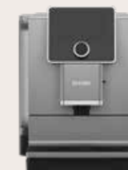
NICR 9'70 Titanium/Chroom