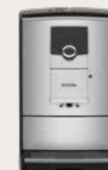
NICR 7'99 RVS/Chroom