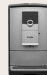
NICR 7'95 Titanium/Chroom