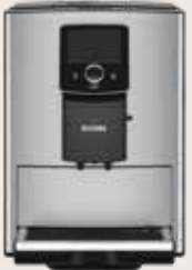
NICR 8'25 RVS/Chroom