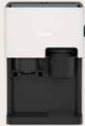
CUBE 4'102 Cremewit