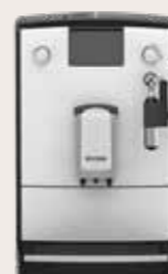
NICR 5'60 Wit/Chroom