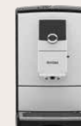
NICR 7'96 Wit/Chroom