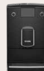
NICR 6'90 Zwart/Chroom