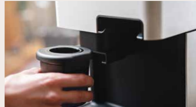
Afbeelding Nr. 01